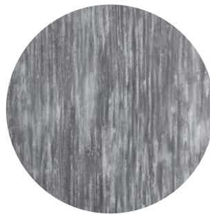
Effetto ematite / hematite effect