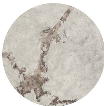
Acrisyl Decora + Roxidan effetto roccia / rock effect