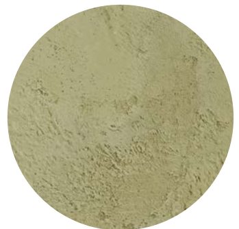
Effetto monostrato + velature / monolayer effect + velature