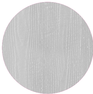
Effetto cassero / cassero effect

Per maggiori informazioni / For more information