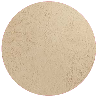
Effetto pietra / stone effect

Az Acrisyl Stone texturált dekoratív bevonatokat reprodukál, amelyek a kő anyagszerűségét idézik a homlokzatokon, számos dekoratív lehetőséget kínálva, akár egyetlen rétegben is: texturált hatások, mint a csíkozott, simítóval felhordott és travertin, ideális mindenféle építészeti stílushoz, legyen szó dekorációról és védelemről hagyományos vakolt felületeken vagy külső hőszigetelő rendszereken. Különleges mikrocelluláris formulájának köszönhetően az Acrisyl Stone könnyített bevonatokat hoz létre, melyek magas kiadássággal rendelkeznek kilogrammonként, így csökkentve a homlokzat súlyát.