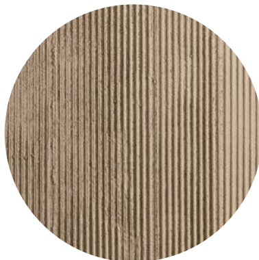
Effetto rigato / striped effect