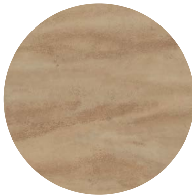
Effetto travertino / travertine effect