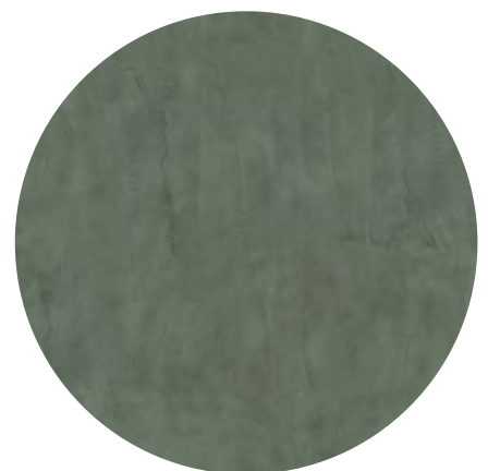
Effetto testurizzato / texturized effect