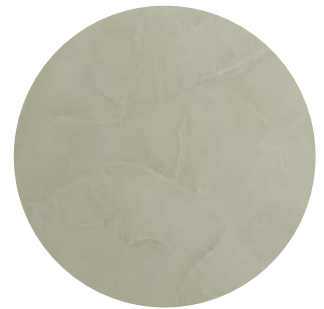
Effetto stucco / stucco effect