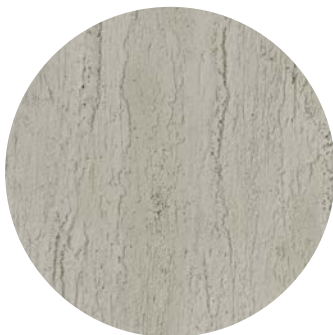
Effetto rigato / striped effect

Per maggiori informazioni For more information