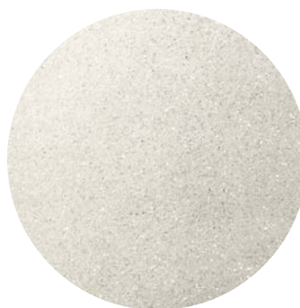
Effetto cristal / cristal effect