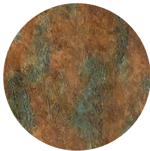
Concret_Art + Roxidan / effetto oxidised / oxidised effect