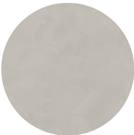
Effetto naturale / natural effect

Per maggiori informazioni For more information