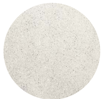
Effetto granito / granite effect