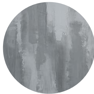
Effetto impacted / impacted effect