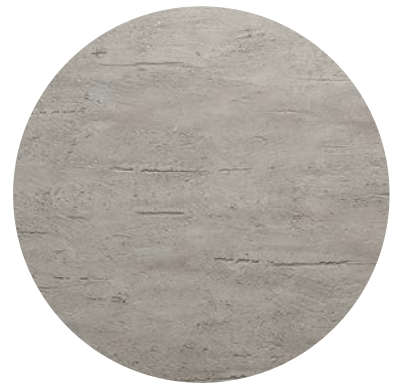
Effetto tonalized / tonalized effect