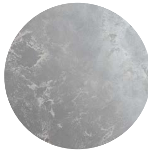
Concret_art + Lunanuova / effetto rock / rock effect