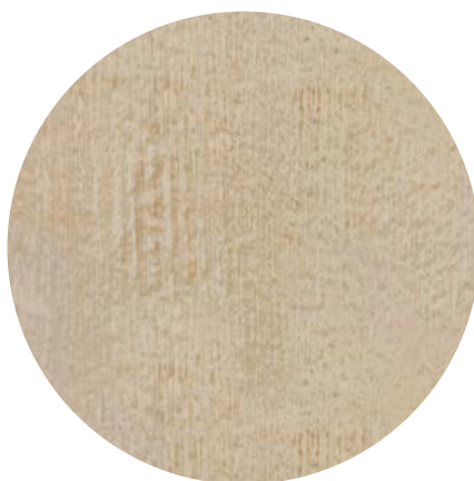
Effetto rigato / striped effect