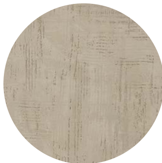
Effetto travertino / travertine effect