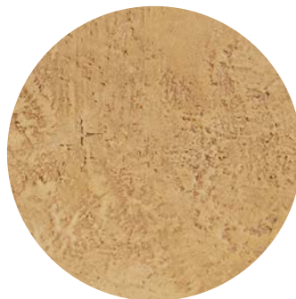
Effetto monostrato / monolayer effect