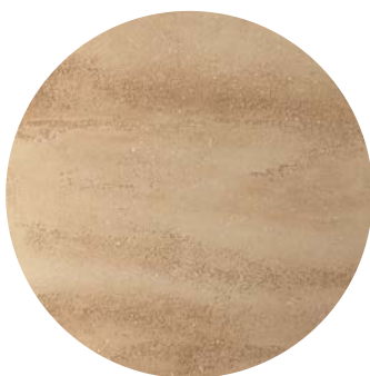
Effetto travertino / travertine effect

Az Acrisyl Decora gránit vagy természetes kő megjelenésű bevonatot kínál, amelyet a textúrába ágyazott apró kristályok díszítenek, lenyűgöző hatásokat keltve a fény visszaverődése szerint. A termék kifinomult stílusú megoldást nyújt, miközben olyan felület hoz létre, amely ellenáll a légszennyeződésnek, és védelmet nyújt a penész és alga kialakulása ellen. Emellett ideális hőszigetelő rendszerekkel borított falakra is.